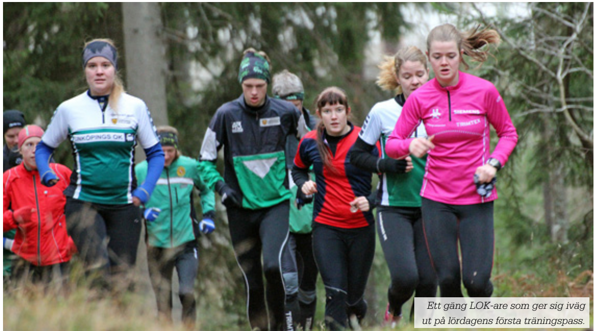
Ett gäng LOK-are som ger sig iväg ut på lördagens första träningspass.